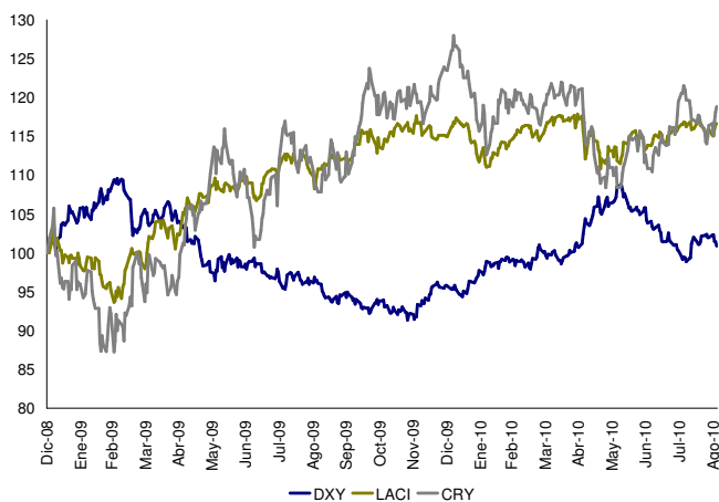
Índices DXY, LACI y CRY Índice base 100=31 de diciembre de 2008

Hoy después de una estrategia coordinada, adelantada por los bancos centrales y los gobiernos de las principales economías desarrolladas del mundo, el escenario parece mostrar que lo más grave pasó. No obstante, algunas señales de menor crecimiento frente a lo esperado en las economías desarrolladas, particularmente en los Estados Unidos, aumentan el riesgo de una doble caída de la economía. En Europa, el mejor desempeño de Alemania no alcanza a compensar la grave situación de España, Portugal, Grecia, y la recientemente desaceleración de Francia, lo que impone retos en el corto y en el mediano plazo a la autoridad monetaria.